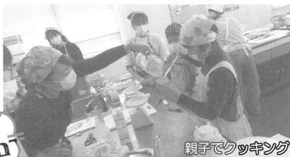
親子でクッキング