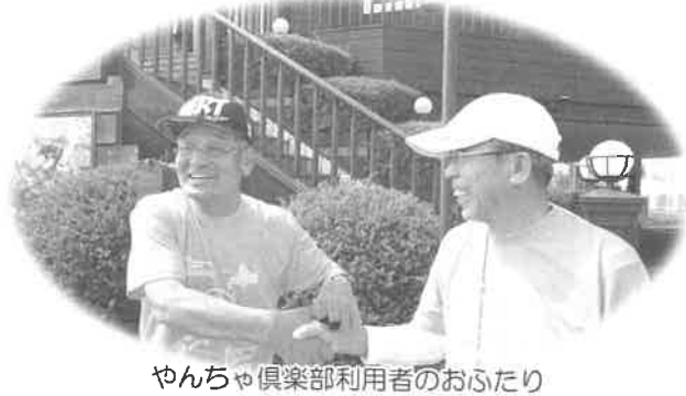
やんちゃ倶楽部利用者のおふたり

参加費 無料 申込 7月10日(火)から泉大津市地域包括支援センターへ来所または電話でお申込みください。 (住所)泉大津市東雲町9-54 (市役所東側・ベルセンター内) (電話)21-0294