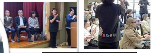
こひつじによる手話