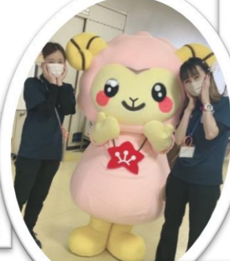
ハートちゃんも 大活躍!