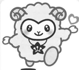
泉大津市社協イメージキャラクター ハートちゃん