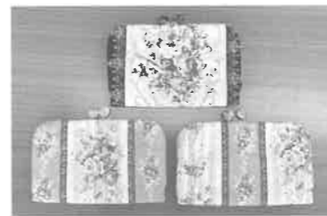
(かわいいお薬手帳ケース)

また、希望者にはボランティア連絡会所属のさわる絵本作成ボランティア「そよかせ」のみなさんにご協力いただき、『かわいいお薬手帳ケース』を2か月にわたって作成します。