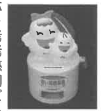
やさしさ365日募金箱イメージ図

彩華・辻尾真進堂薬局・特別養護老人ホーム百楽園・特別養護老人ホームオズ・特別養護老人ホーム覚寿園・特別養護老人ホームローズガーデン条南苑・介護老人保健施設アザリア・軽費老人ホーム慈恵園・みらいすこども園・認定こども園アンビーこども園・認定こども園アイビースクール・認定こども園ぱる・くつろぎ処べっかんこ・家族庵・ホテルきららリゾート関空・ワークショップかりん・ワークさつき・和泉乳児院・ふじいただひろ整骨院・菓子処ふる里・FMいずみおおつ・泉大津ロイヤルテニスクラブ